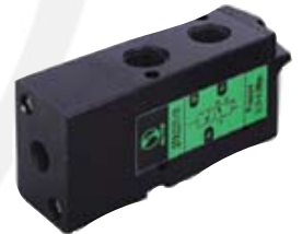
3A3 0 10